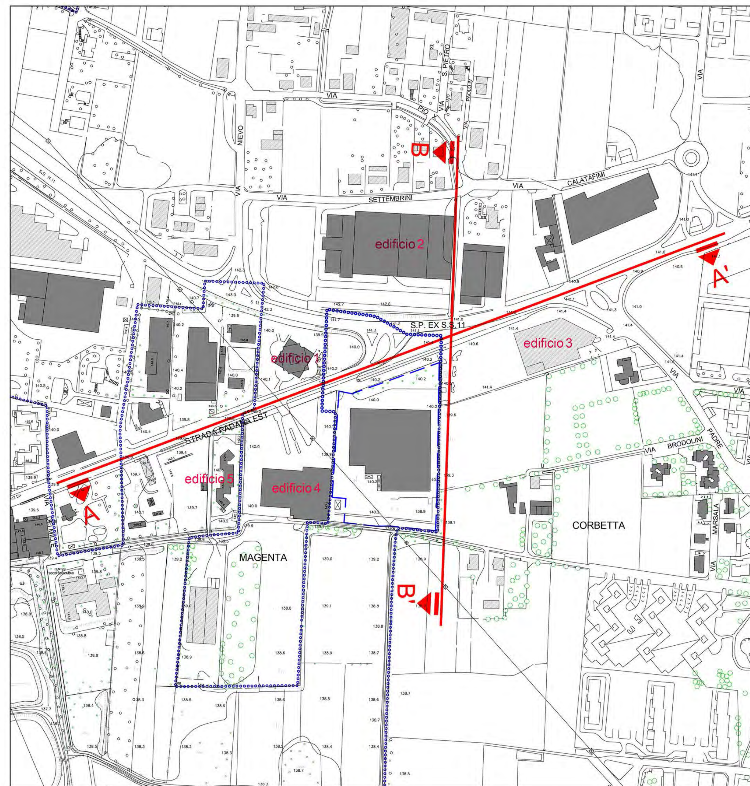
STRALCIO AEROFOTOGRAMMETRICO - 1:2000